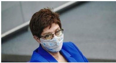
DONAUKURIER.DE Berlin: Verteidigungsausschuss stimmt Beschaffung neuer Eurofighter zu

Hier geht's zum Bericht des Donaukurier.