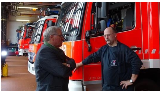
Archivbild vom Besuch der Freiwilligen Feuerwehr Gersthofen im Jahr 2019.